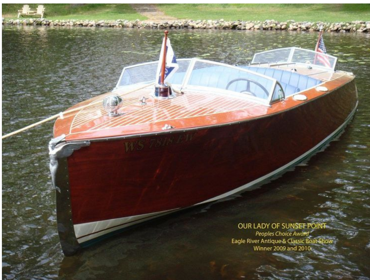
OUR LADY OF SUNSET POINT Peoples Choice Award Eagle River Antique & Classic Boat Show Winner 2009 and 2010