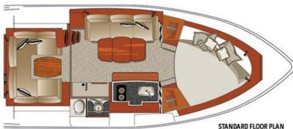
STANDARD FLOOR PLAN