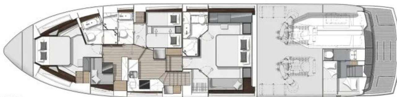
LOWER DECK Shown with optional sliding access door to the guest cabin.