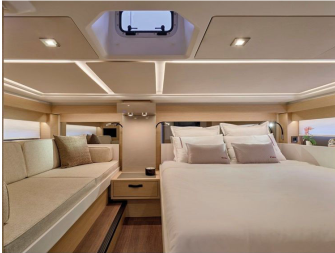
Jeanneau DB 43