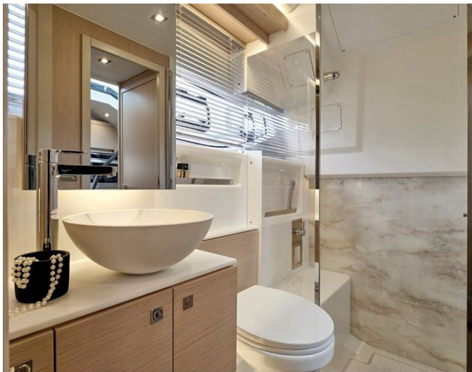
Jeanneau DB 43