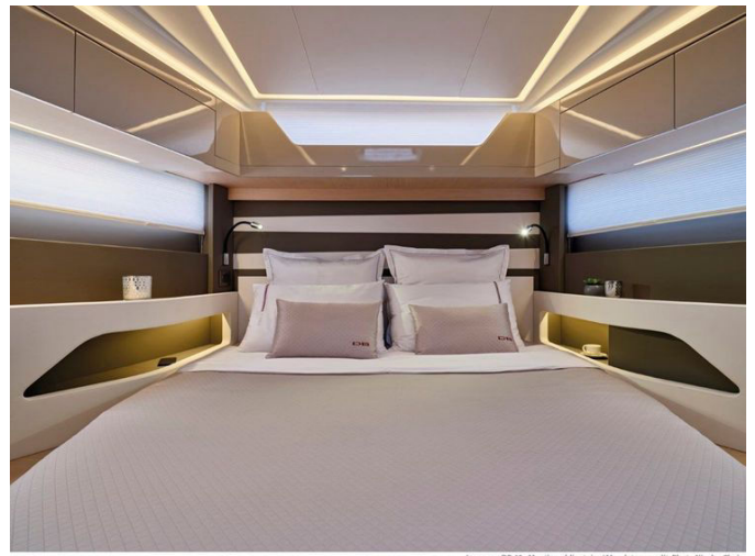
Jeanneau DB 43