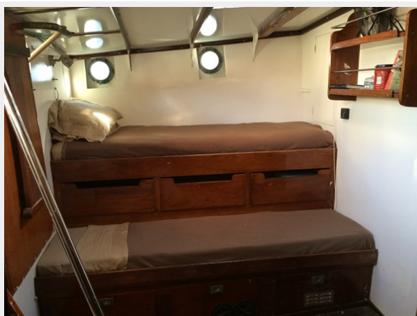
Fwd Cabin Berths 1