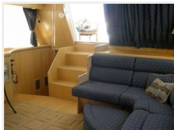
Salon Entry & Sofa