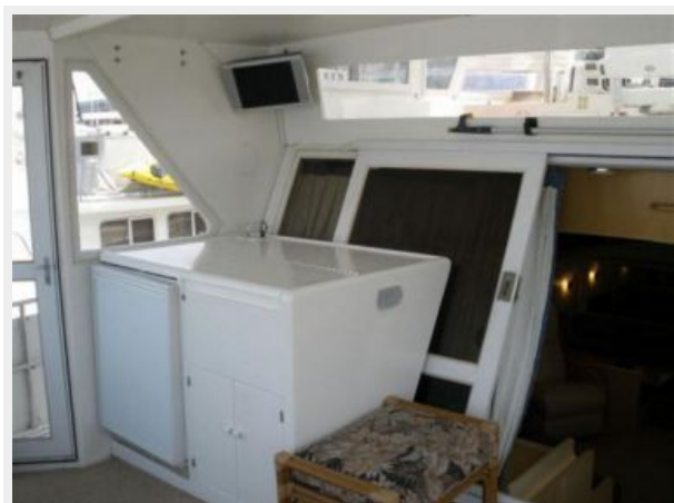
Wet Bar & TV