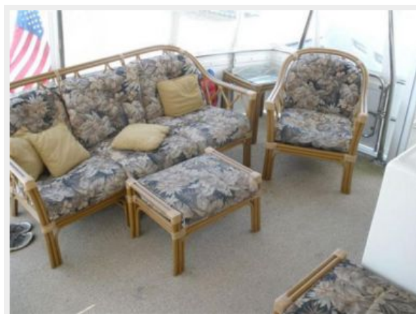
Aft Deck Seating