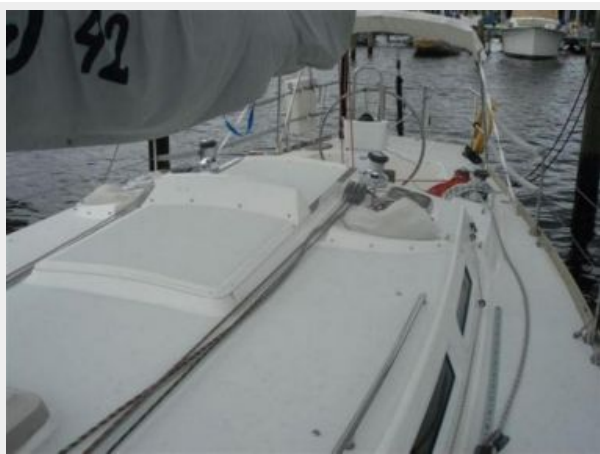
DECK & COCKPIT LOOKING AFT