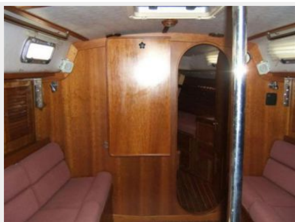
SALON LOOKING FORWARD