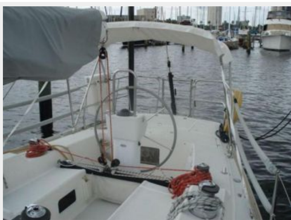
COCKPIT & HELM