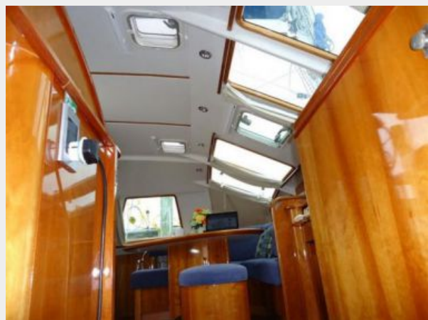
Plenty of natural light