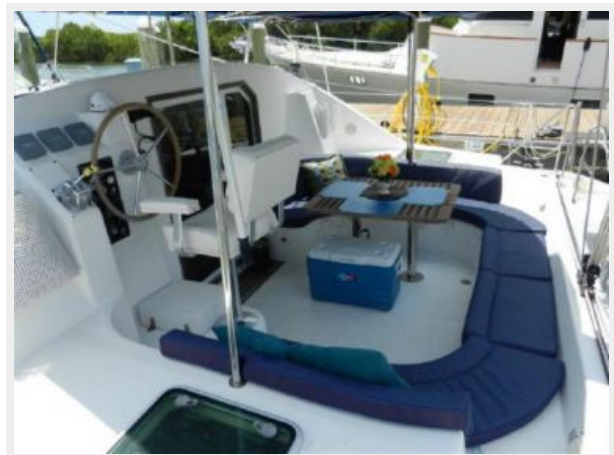
Plenty of Room for Guests!