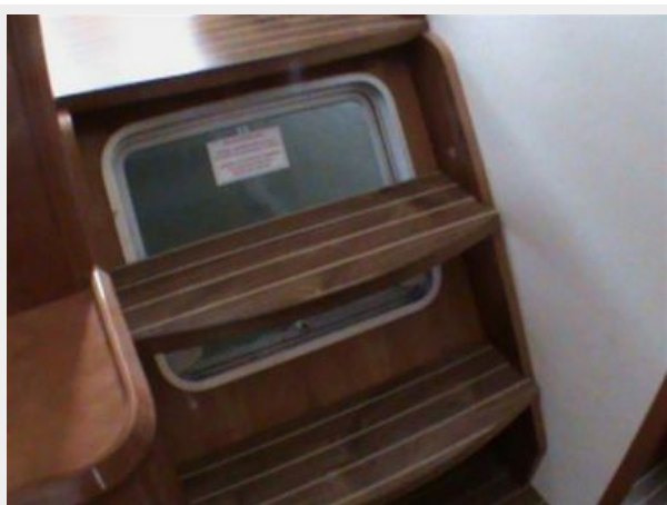
Port Escape Hatch