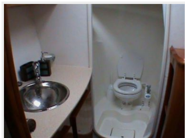
Master Head area