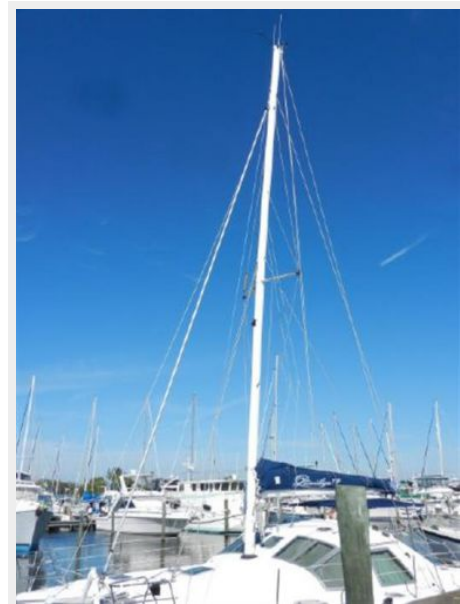
Mast and Rigging