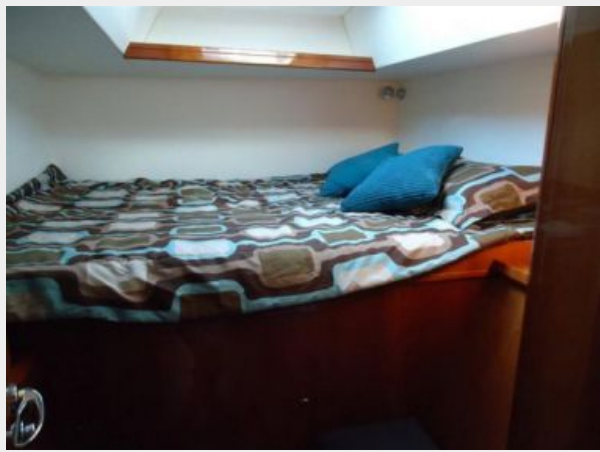
Stbd Guest berth