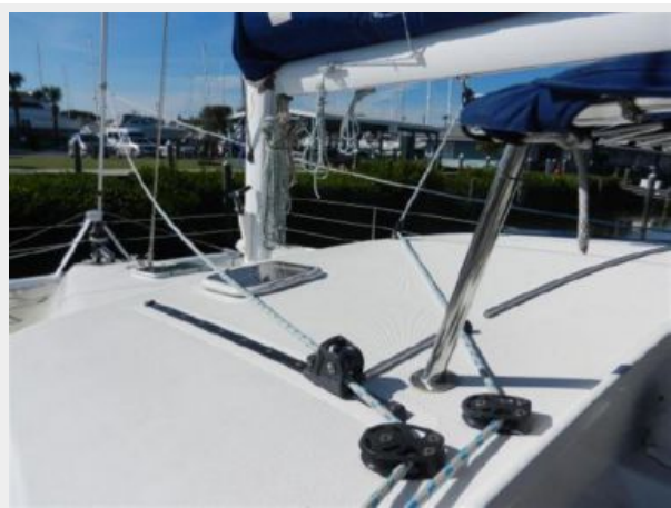
Lines to Cockpit