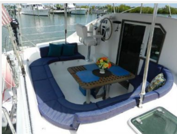
Large Shaded Cockpit