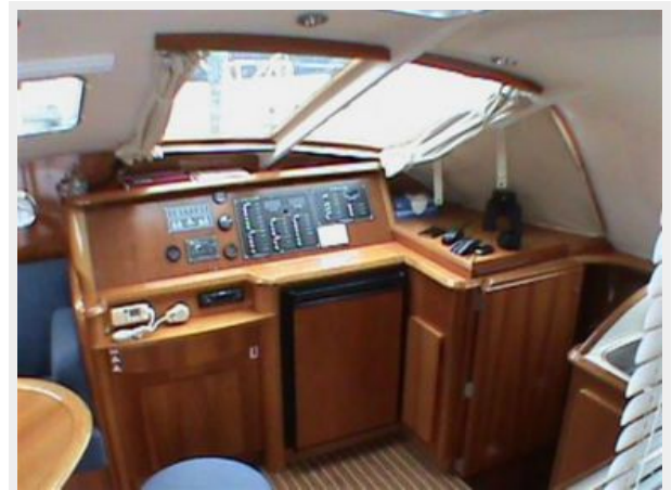
Station and Refrigerator