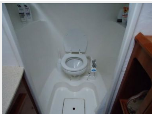
Head and shower