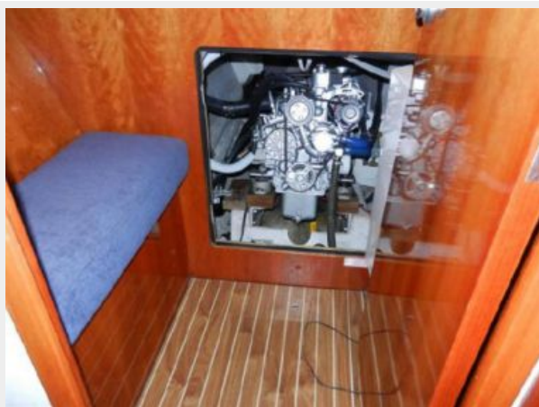
Engine Under Port Berth