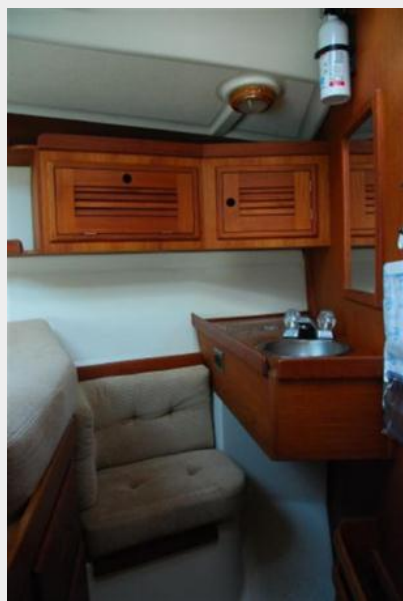
Vanity in V Berth