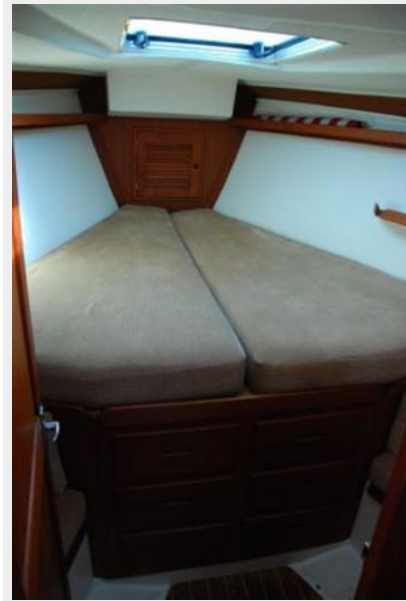
Forward V Berth