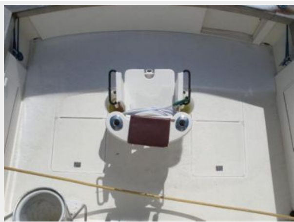
Cockpit and Fighting Chair