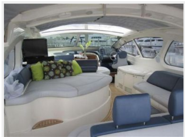
Cockpit Sitting Area