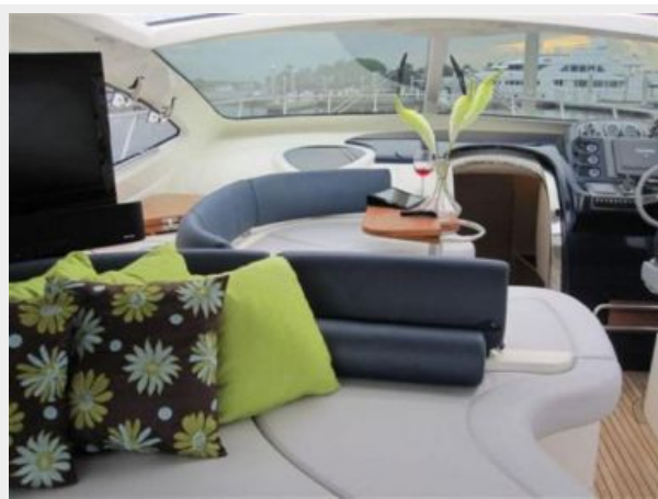
Cockpit Seating Area