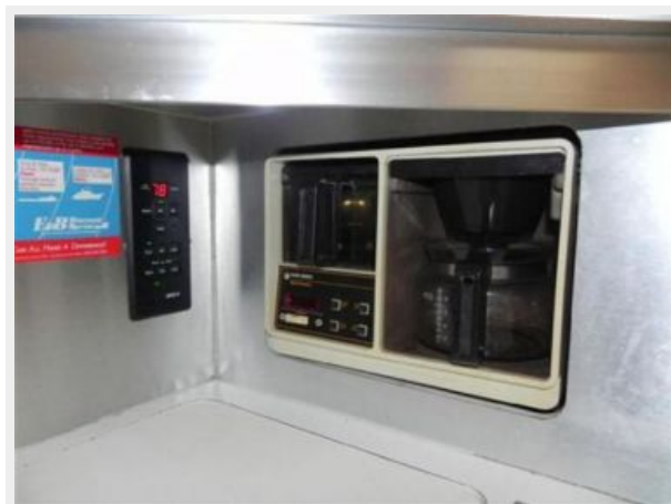
Head w/ Enclosed Shower