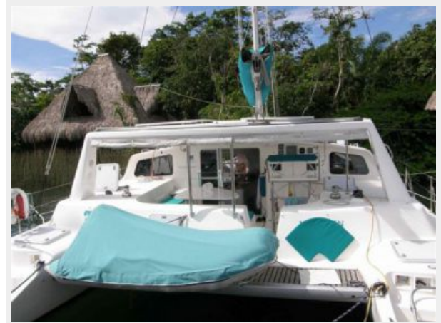
COCKPIT AND DINGHY