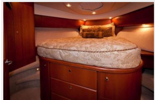
VIP Stateroom Storage