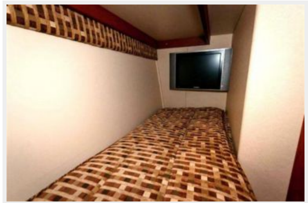
Guest Stateroom TV