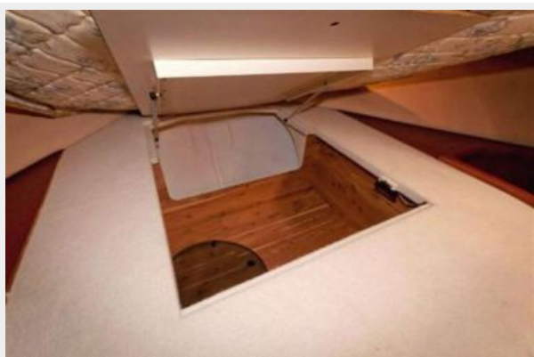
VIP Cedar Lined Storage Under Berth