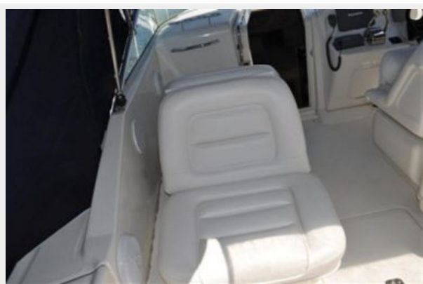
Port Side Seating