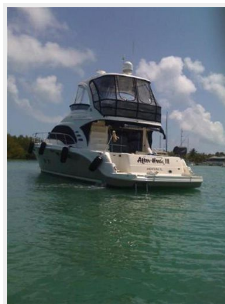
500 Sedan Bridge