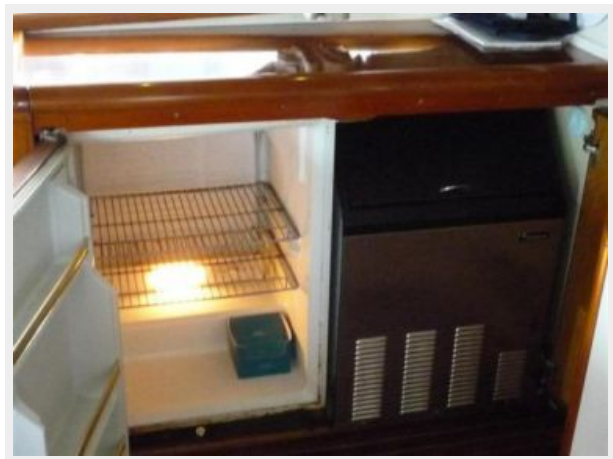
Galley Teak Counters