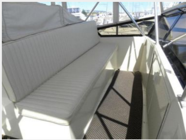
Front Facing Guest Seating Bridge