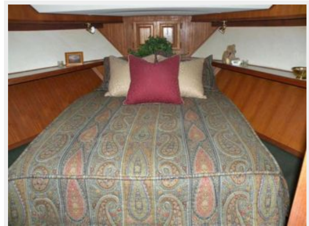
Master Forward berth