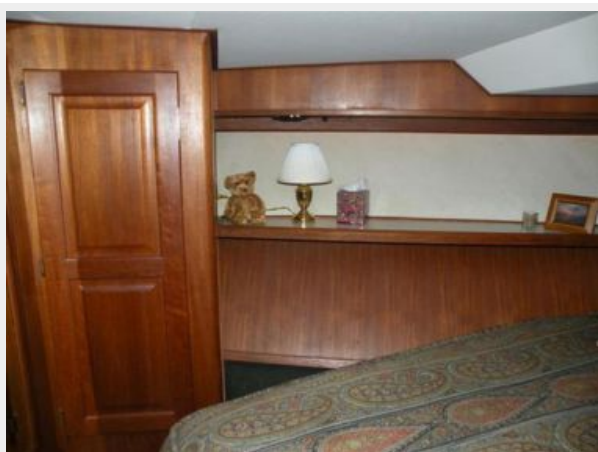
Port Side view in Master