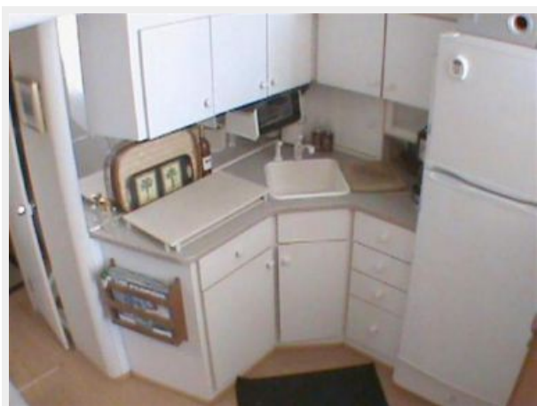
Galley View 1