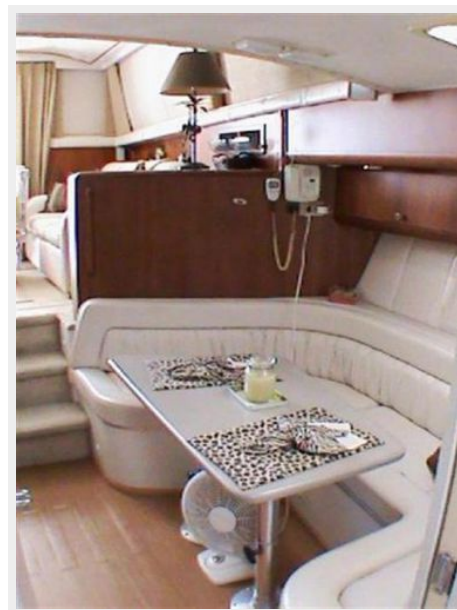
Dinette View 2