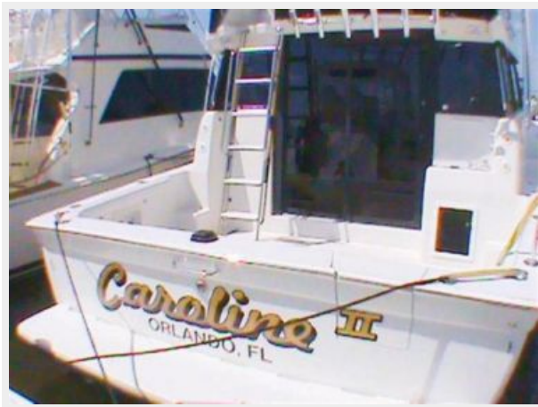
Sliding Entry Door