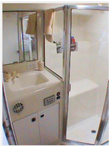
Head and Shower View 1