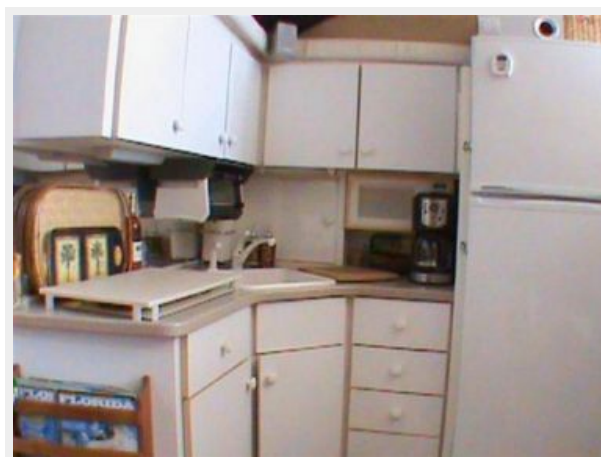
Galley View 2