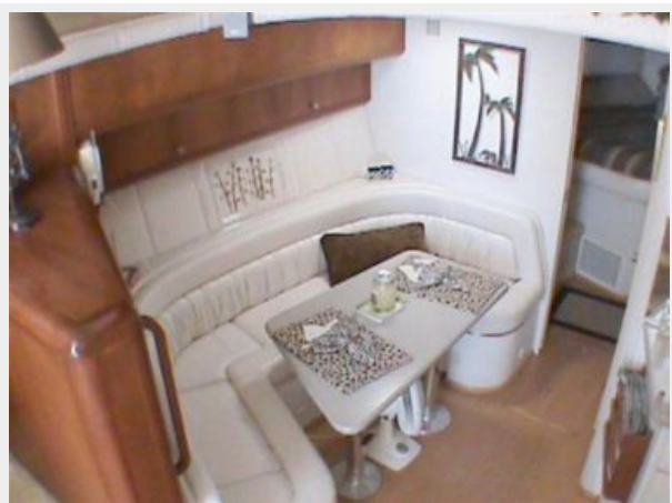
Dinette View 1