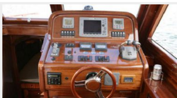
From Vicem brochure - helm