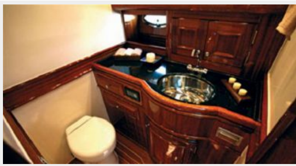
From Vicem brochure - head