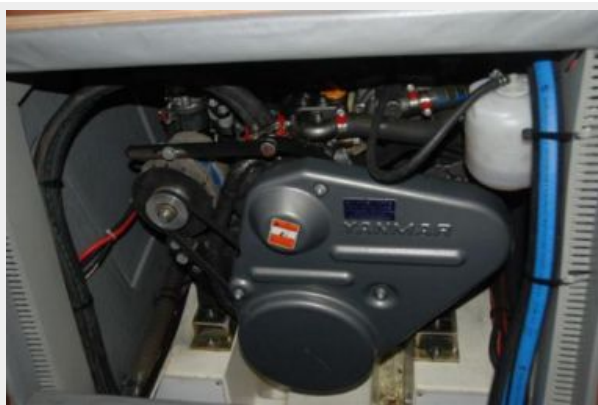
Yanmar with Twin Alternators