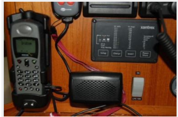
Sat Phone, etc