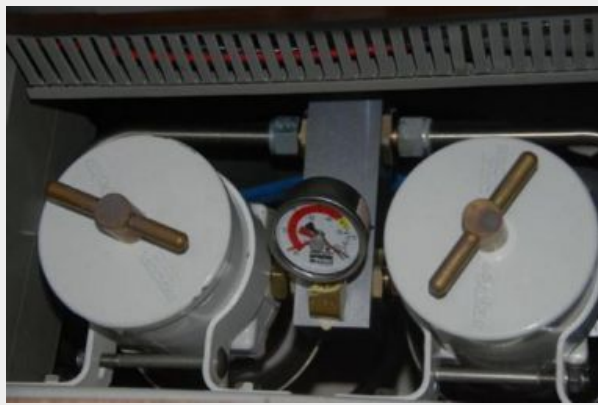
Custom Dual Filters