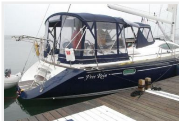
Cockpit Full Enclosure