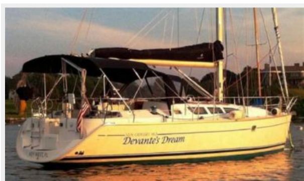
Profile at sunset