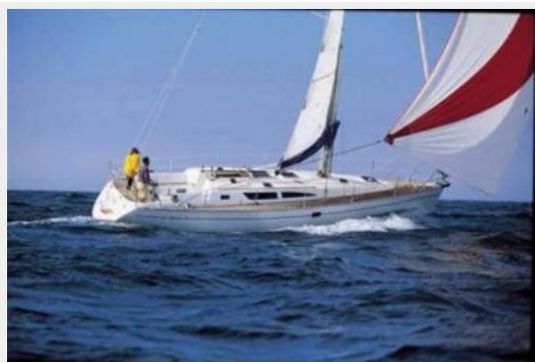
Manufacturer Provided Image: Sun Odyssey