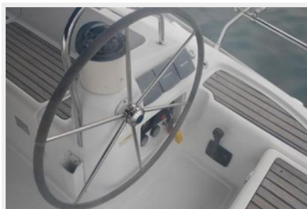
Starboard Helm Station