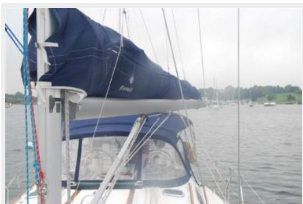
Stack pack and dodger