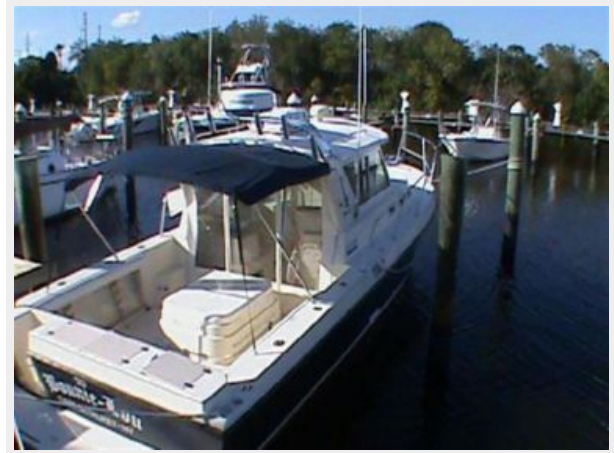
Starboard rear quarter