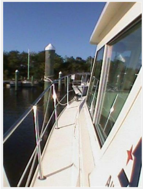
View Fwd port side