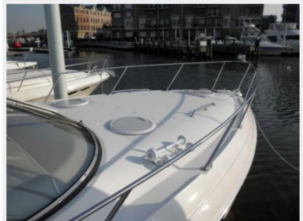
Bow With windlass