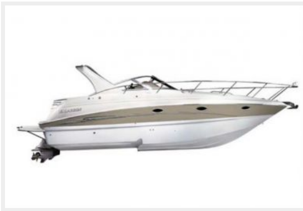
Manufacturer Provided Drawing