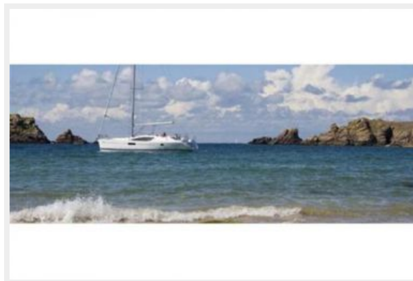
At Anchor