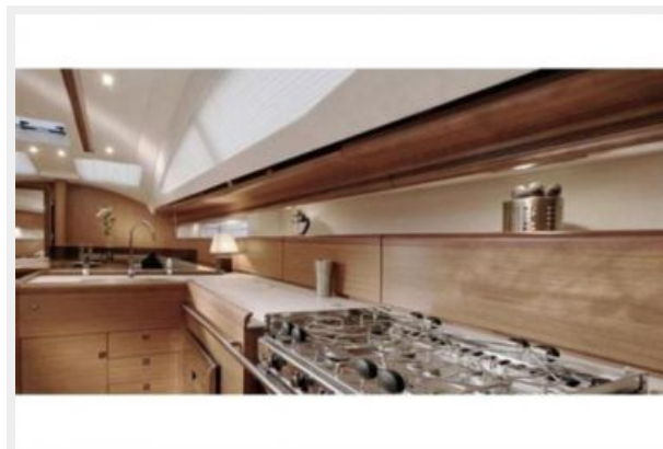
Manufacturer Provided Image: Galley