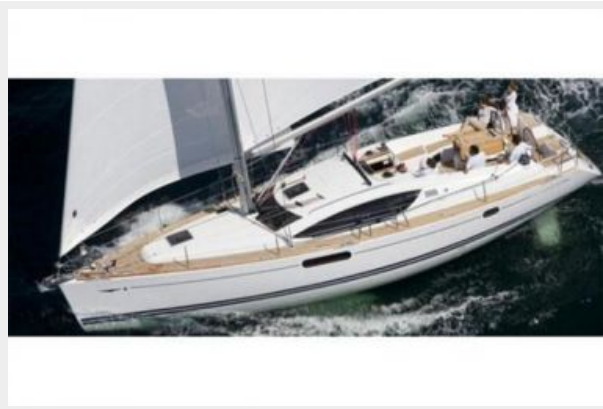
View from Above