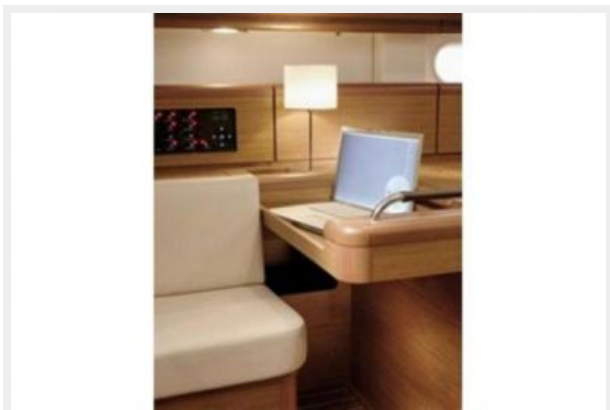
Nav Table