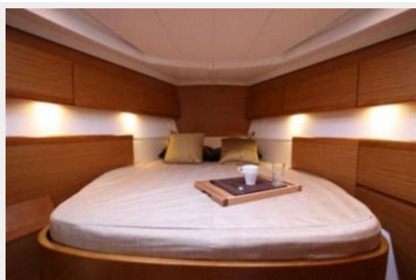
Forward Cabin