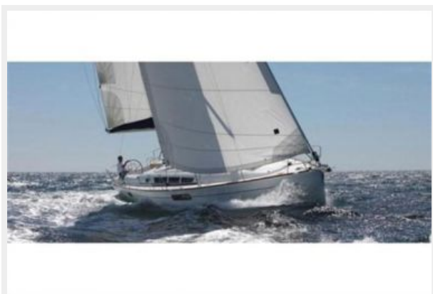
Manufacturer Provided Image: Under Sail