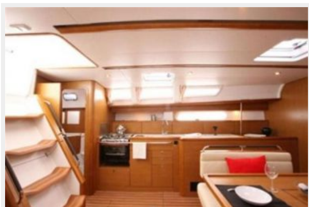
Galley