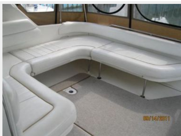
U-Shaped Cockpit Seating