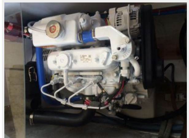
Phasor 9.5 Generator NEW