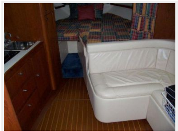
Flat Screen TV