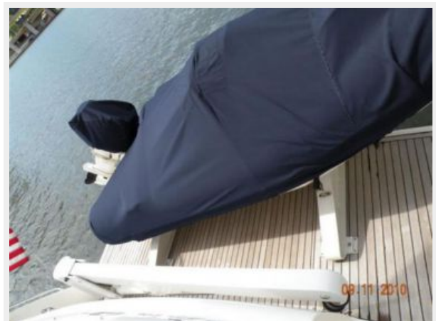
Crane for tender