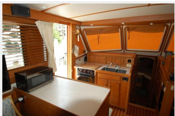
Galley - Port