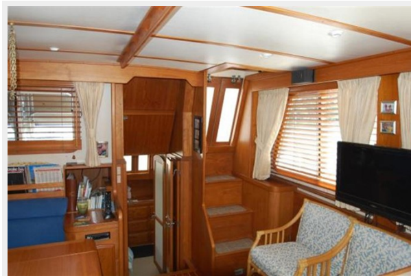
Salon - Stairs leading to aft deck & down to aft cabin.