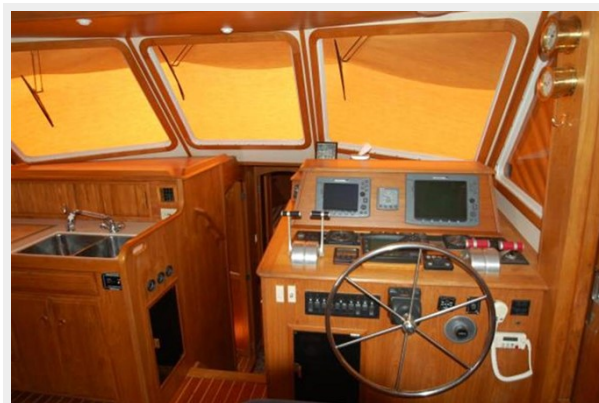
Helm - Starboard