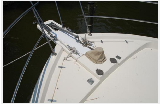
Bow / Anchoring System