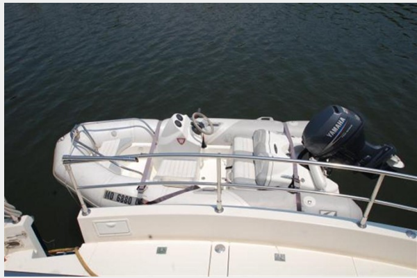
Dinghy on lift