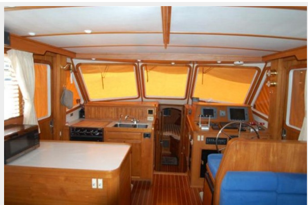
Helm & Galley - Port & starboard doors to side decks.