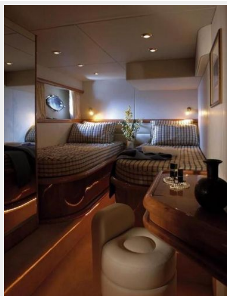
Stbd Cabin