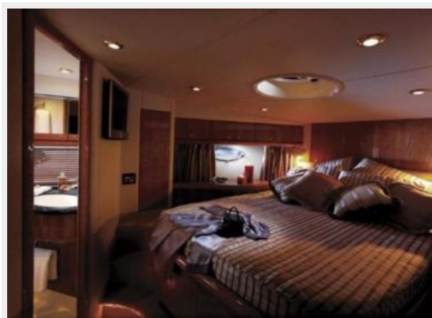
Forward Cabin