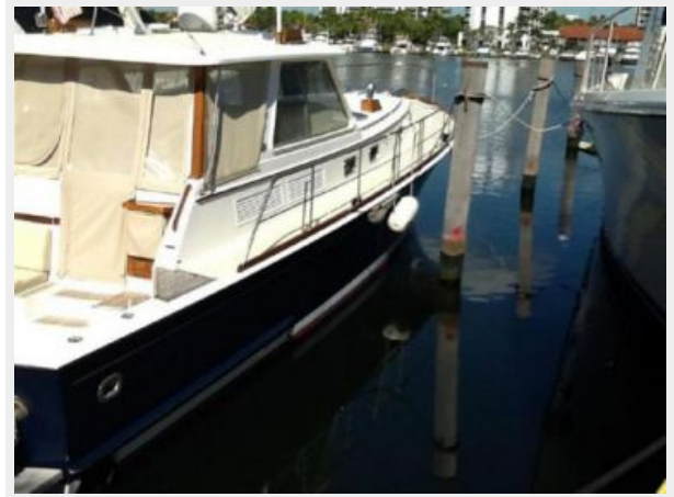
Starboard Side From Aft