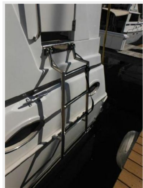
CUSTOM SS BOARDING LADDER