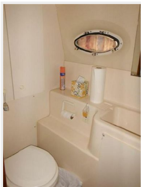
FORWARD HEAD COMPARTMENT