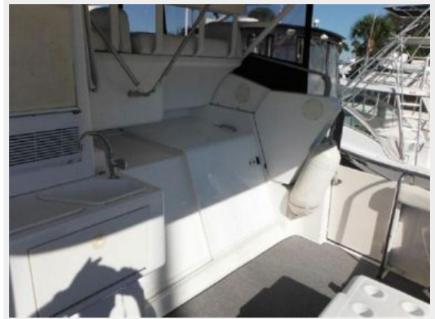
CUSTOM SS BOARDING LADDER