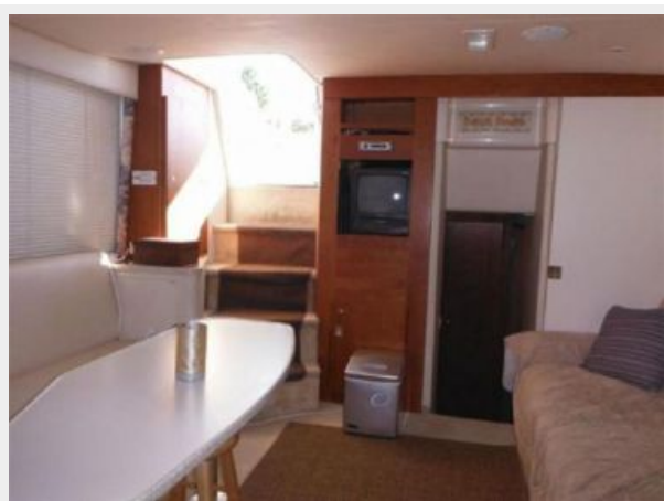
MAIN SALON LOOKING AFT