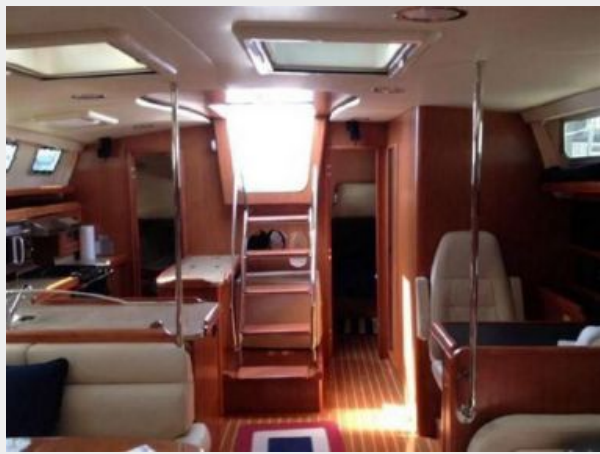
Main Salon looking aft