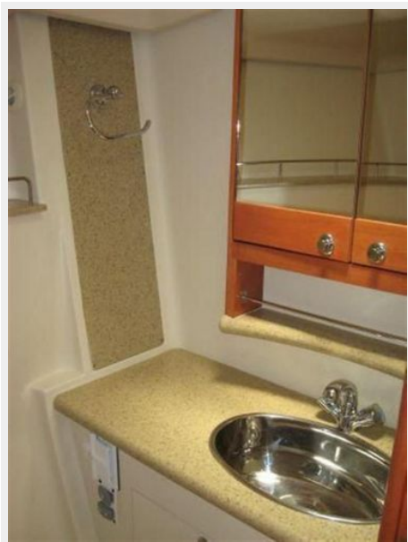
Master Cabin Head & Shower Detail