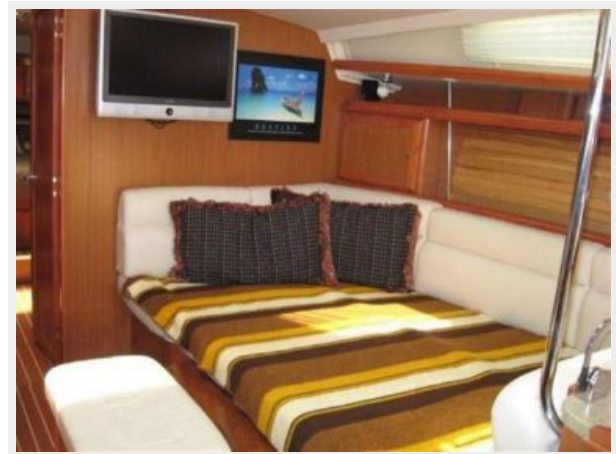
Main Salon Table made-up as sleeping double