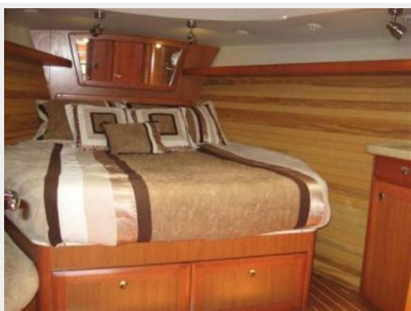
Master Cabin Forward