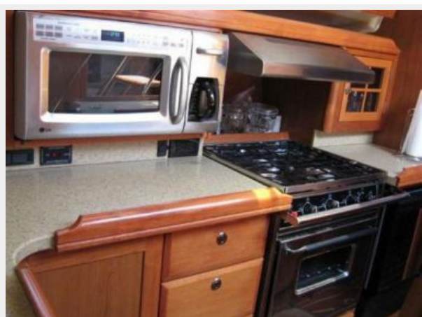
Galley Detail 1