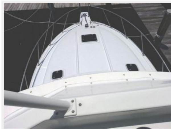
34' Luhrs foredeck