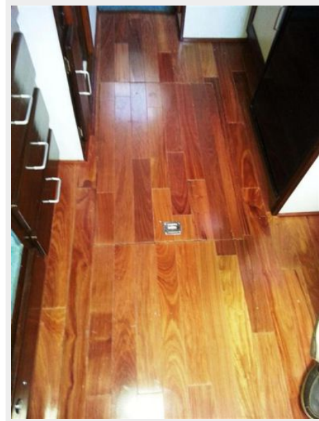
34' Luhrs salon sole