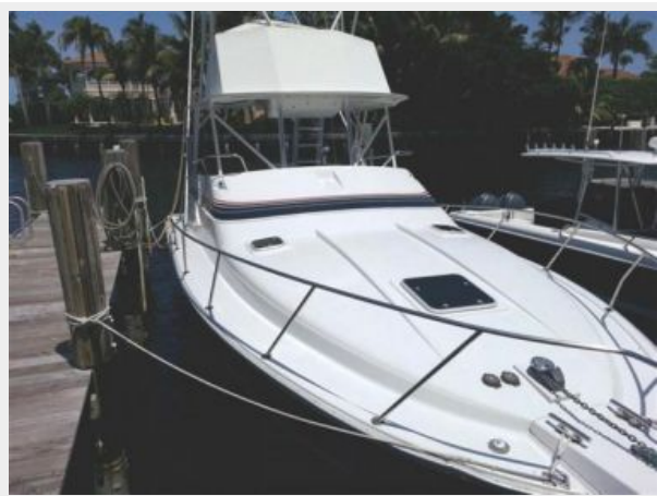
34' Luhrs starboard forward profile