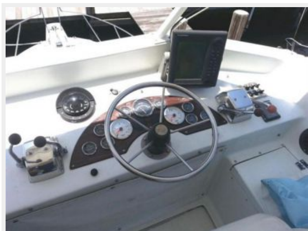
34' Luhrs flybridge helm