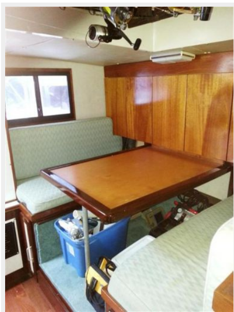
34' Luhrs dinette