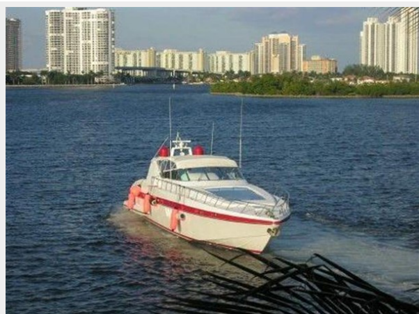
Running Shot 2