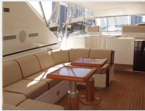
Aft Deck 2