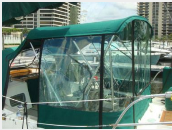
38' Cabo Rico cockpit enclosure