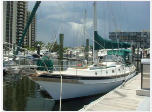
38' Cabo Rico port forward profile