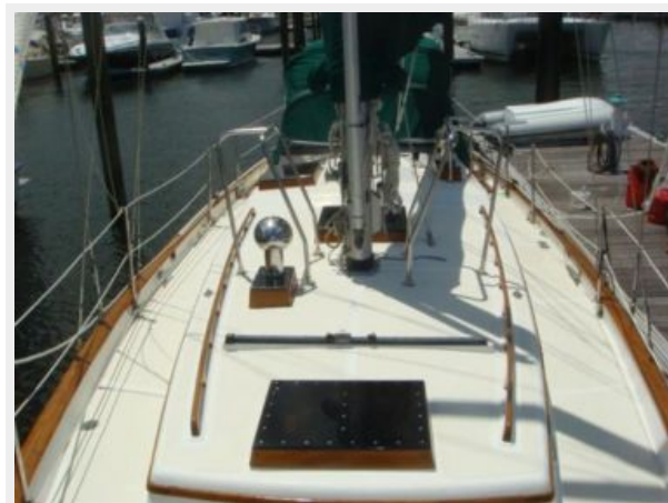
38' Cabo Rico foredeck aft