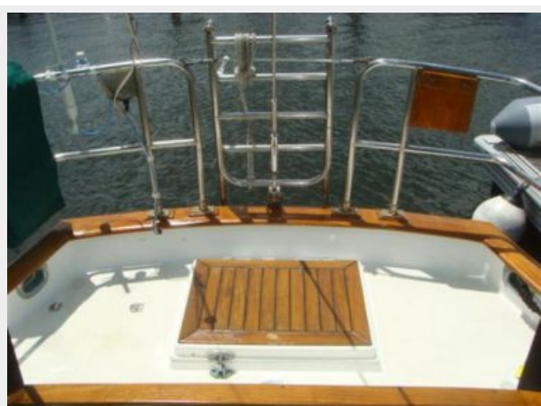
38' Cabo Rico aftdeck