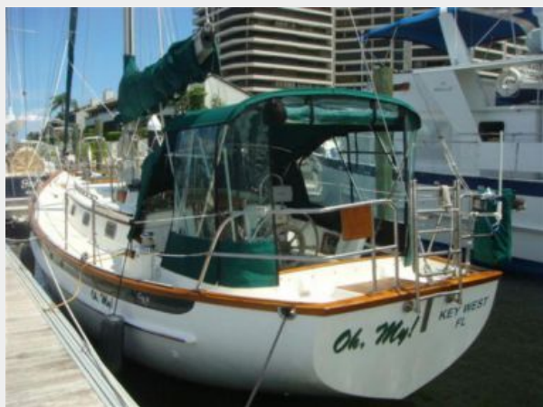
38' Cabo Rico port aft profile