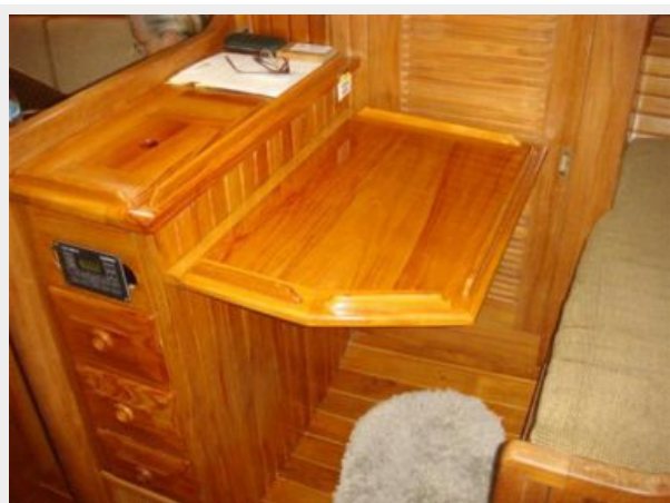
38' Cabo Rico salon desk