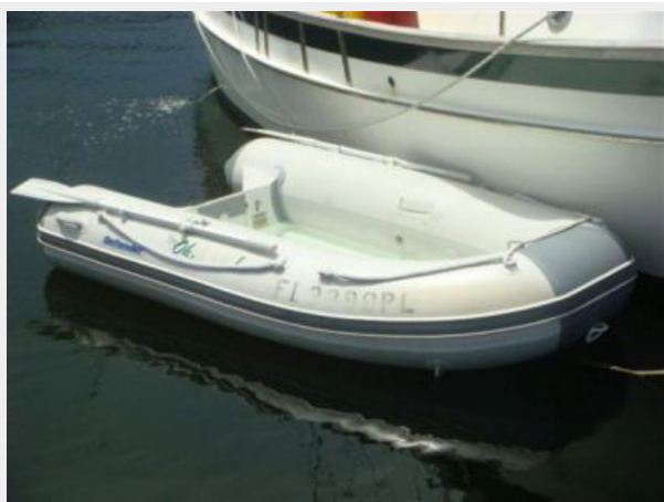
38' Cabo Rico tender photo1