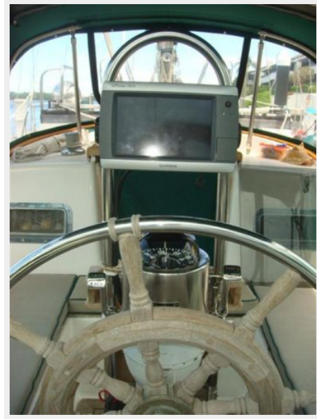
38' Cabo Rico cockpit helm