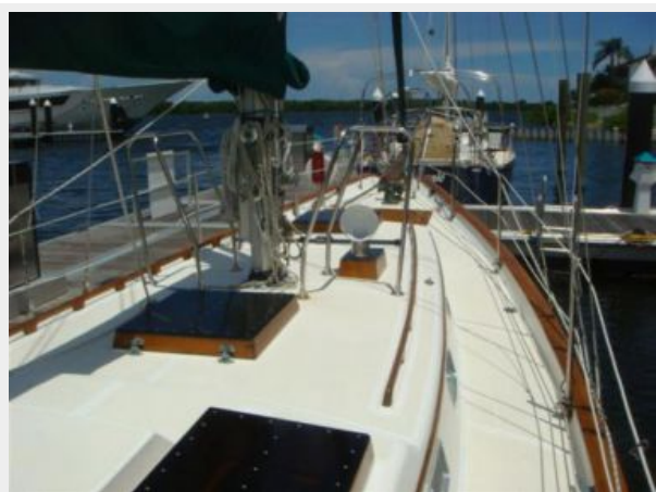
38' Cabo Rico foredeck