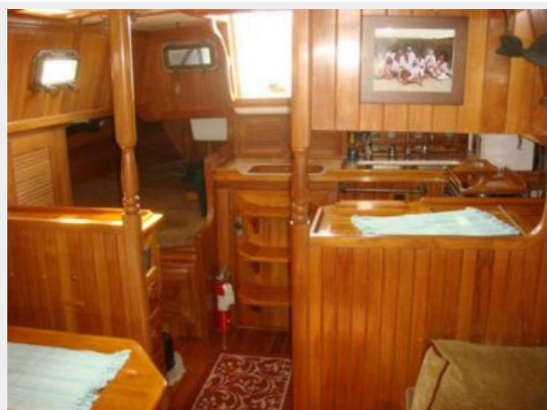
38' Cabo Rico salon aft