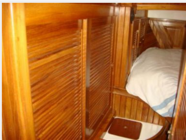
38' Cabo Rico master stateroom port