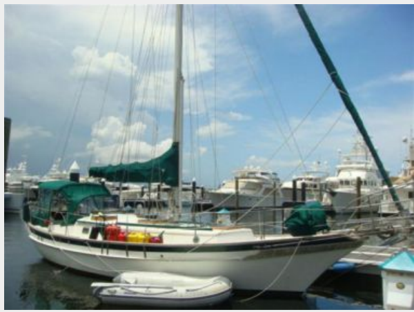
38' Cabo Rico starboard forward profile