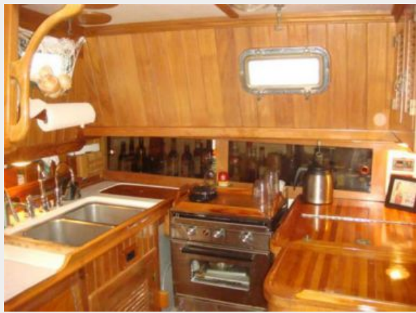
38' Cabo Rico galley