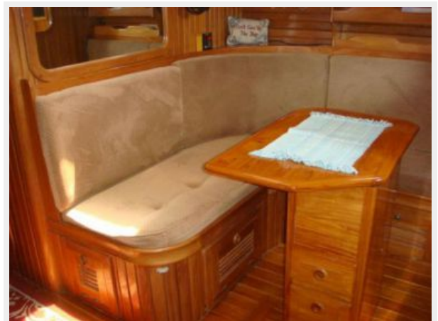
38' Cabo Rico settee