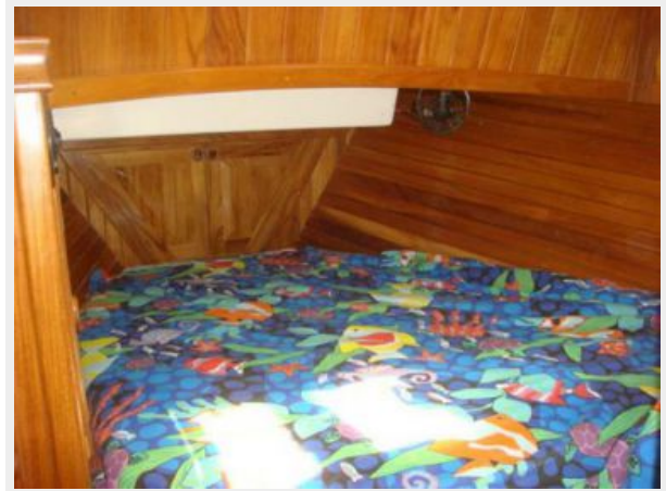
38' Cabo Rico master stateroom