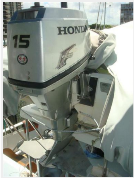
38' Cabo Rico tender outboard