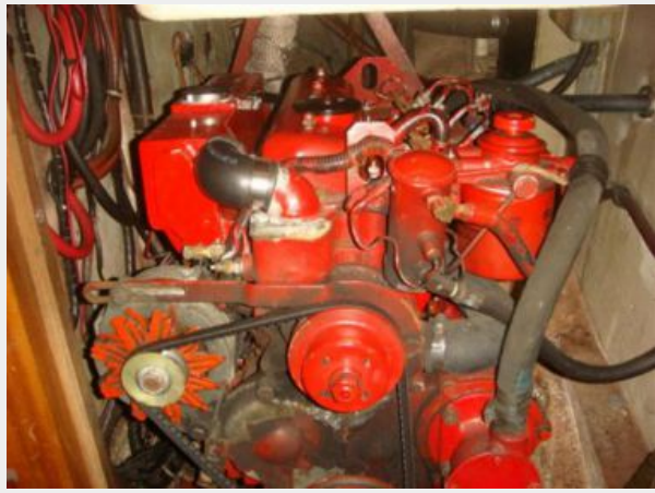
38' Cabo Rico auxilliary