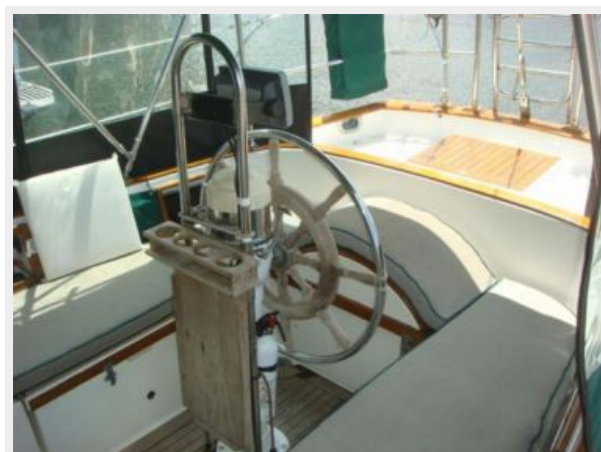
38' Cabo Rico cockpit