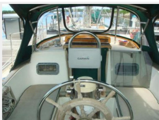
38' Cabo Rico cockpit forward