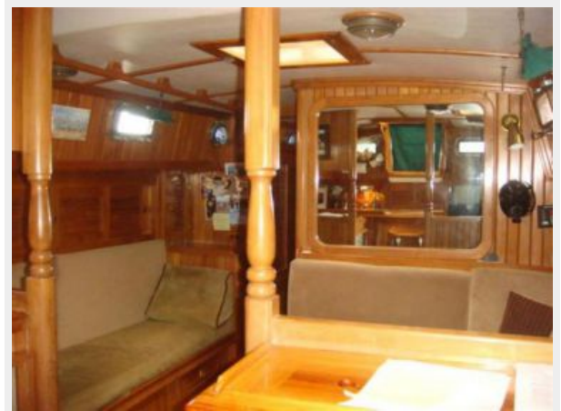
38' Cabo Rico salon forward