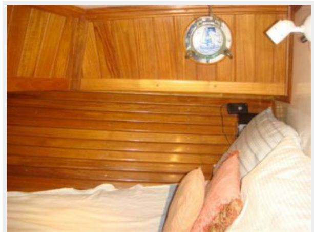
38' Cabo Rico master stateroom starboard