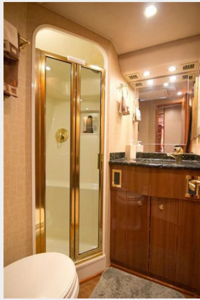
Starboard Guest Head