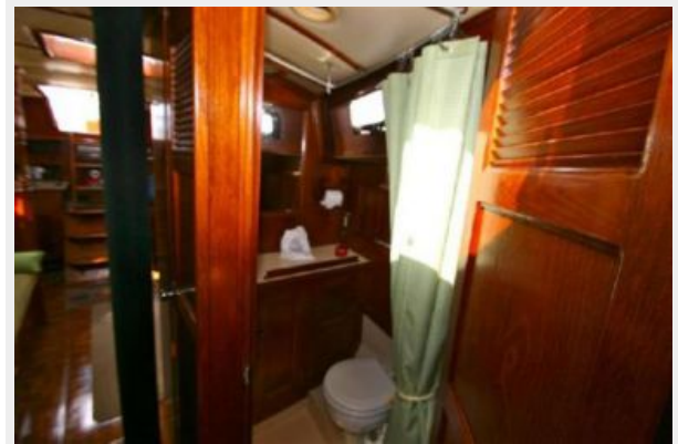
HEAD FROM VBERTH