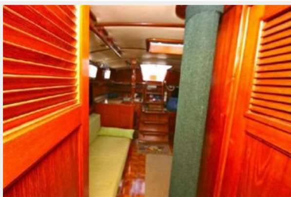
SALON FROM VBERTH