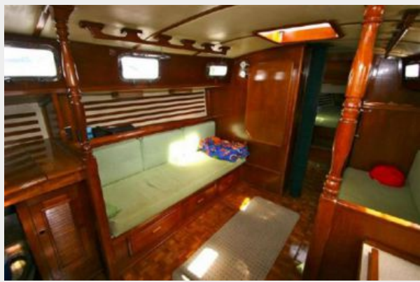
SALON TO PORT WITH TABLE STOWED