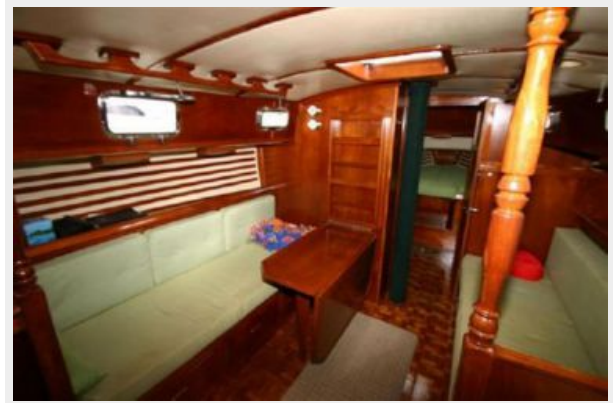
SALON TO PORT WITH TABLE PARTIALLY OPEN