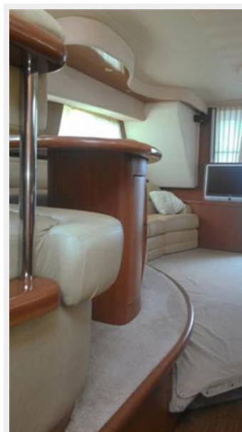
Salon looking Aft