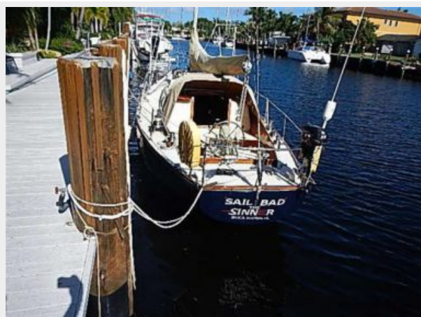
38' Le Comte Northeast aft profile