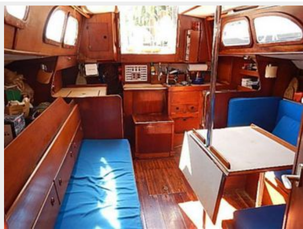
38' Le Comte Northeast salon aft