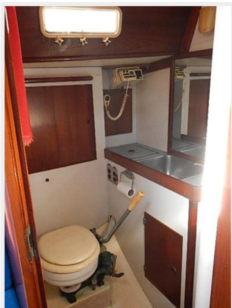
38' Le Comte Northeast head