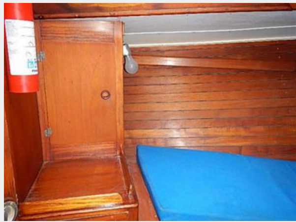
38' Le Comte Northeast stateroom port