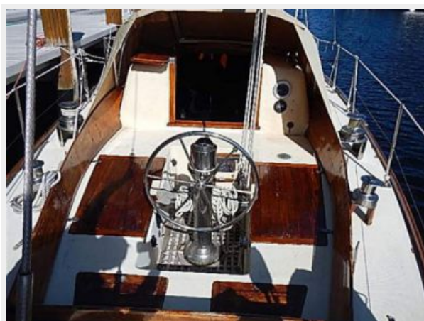
38' Le Comte Northeast cockpit forward