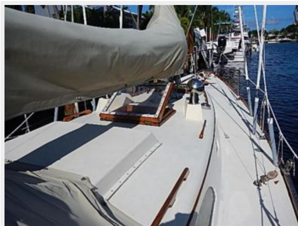
38' Le Comte Northeast foredeck