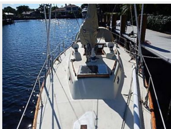
38' Le Comte Northeast foredeck aft