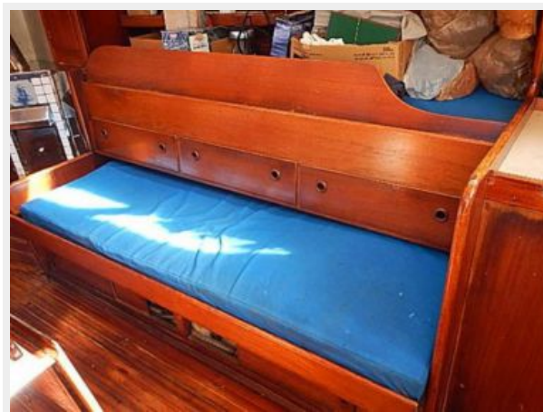
38' Le Comte Northeast salon seating