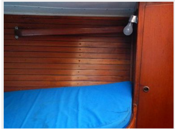
38' Le Comte Northeast stateroom starboard