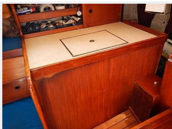
38' Le Comte Northeast refrigeration