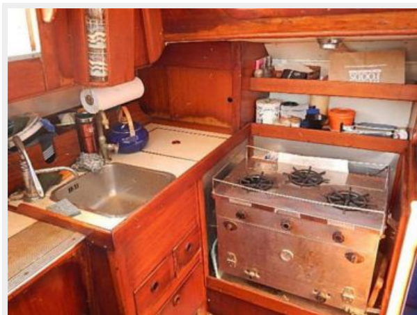
38' Le Comte Northeast galley