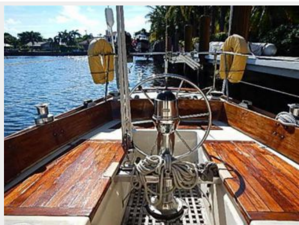
38' Le Comte Northeast cockpit aft