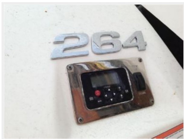
264 - Aft Controls