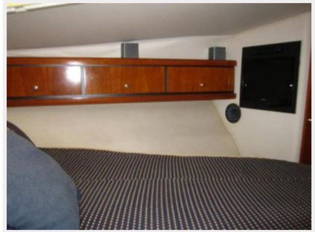
Main Cabin - Newer Flat Screen TV