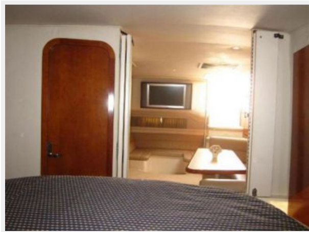
Main Cabin Looking Aft