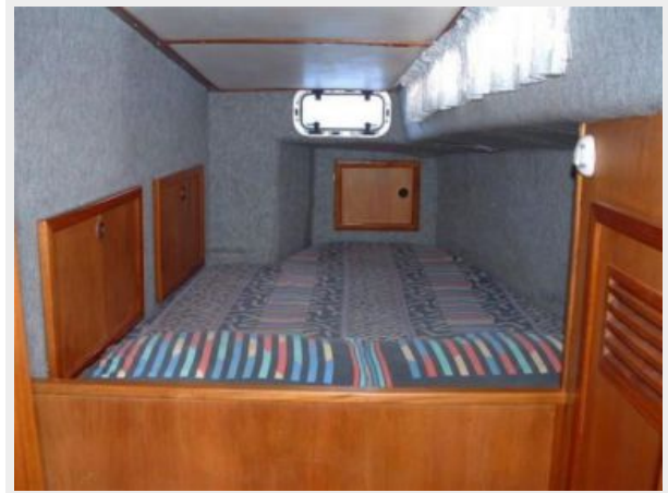
Port Aft Cabin