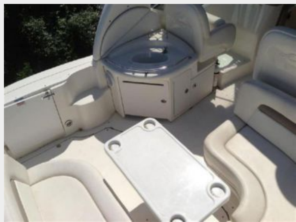
Wet bar - Aft seating