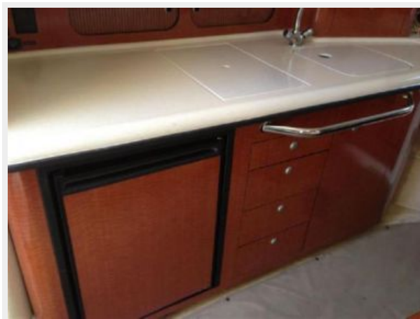
Galley - Facing toward port