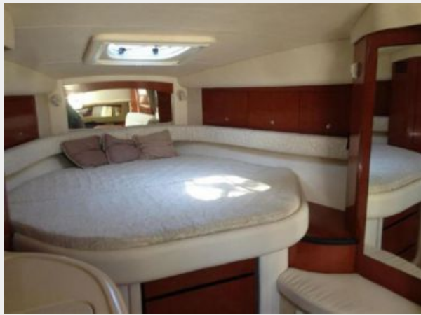
Berth - facing forward