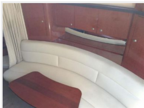
Settee - Facing toward starboard