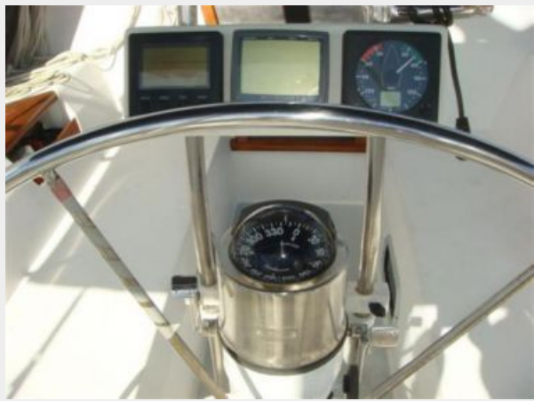
42' Catalina cockpit helm