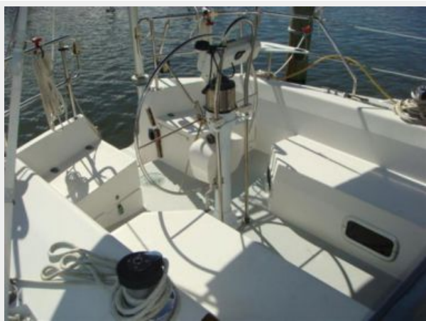
42' Catalina cockpit