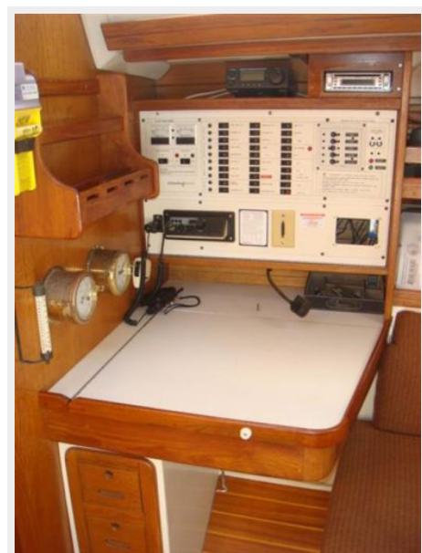
42' Catalina nav station