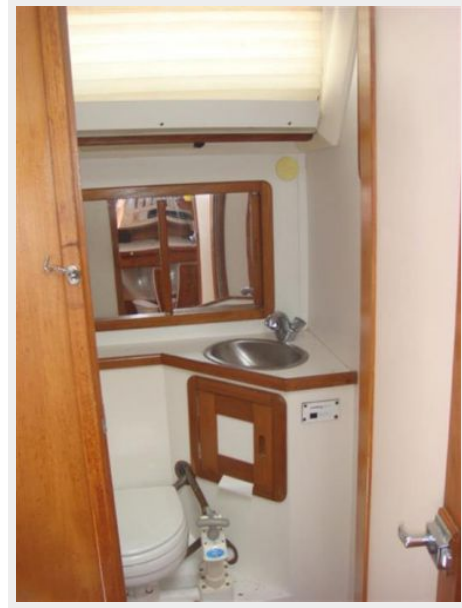
42' Catalina guest head