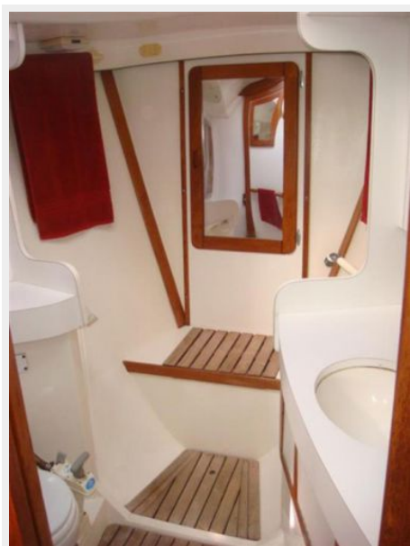
42' Catalina master stateroom head