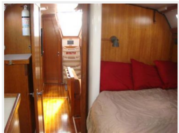
42' Catalina master stateroom aft