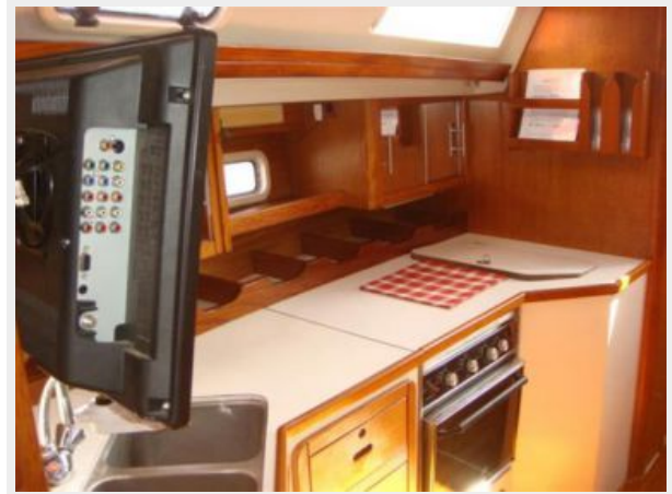
42' Catalina galley photo2