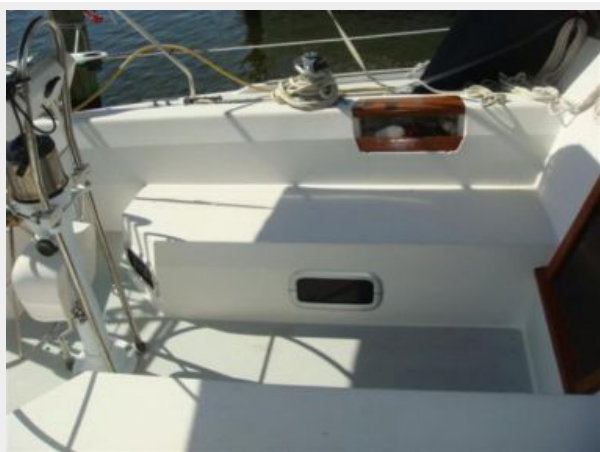
42' Catalina cockpit port