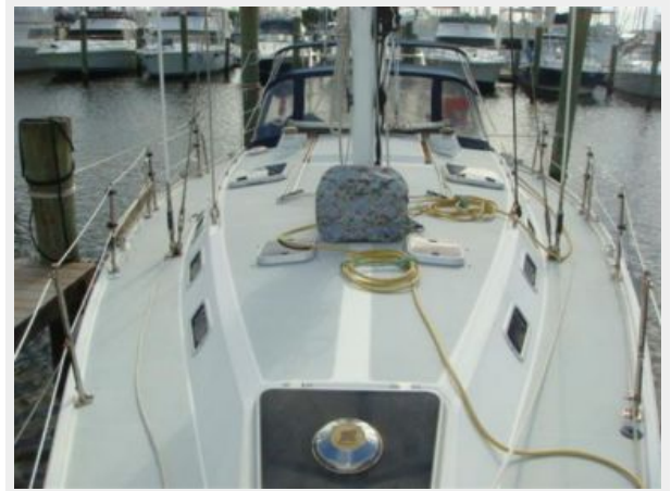
42' Catalina foredeck aft