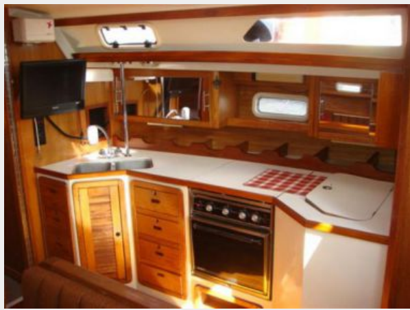
42' Catalina galley photo1