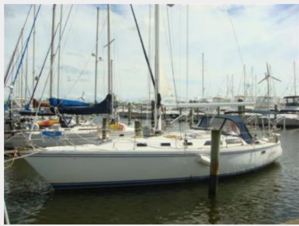
42' Catalina port forward profile