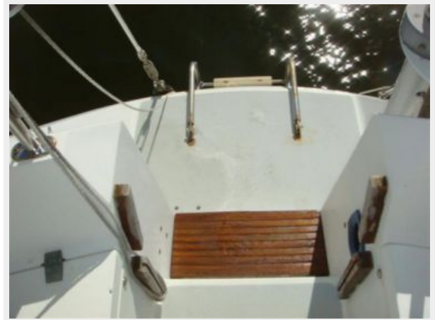
42' Catalina swimplatform