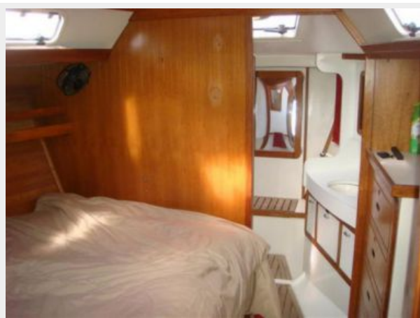
42' Catalina master stateroom forward