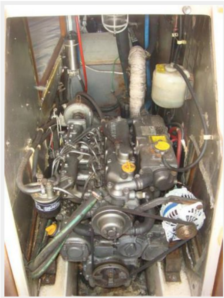
42' Catalina auxiliary