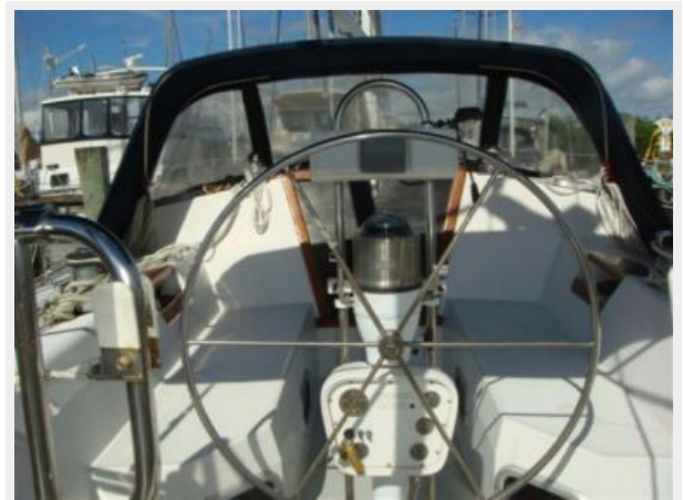
42' Catalina cockpit forward