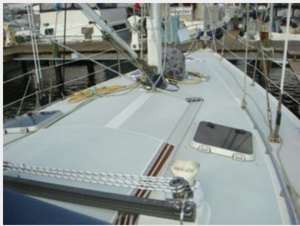
42' Catalina foredeck