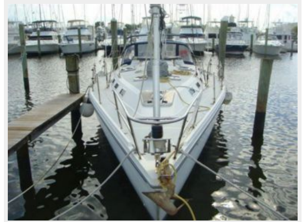
42' Catalina forward profile