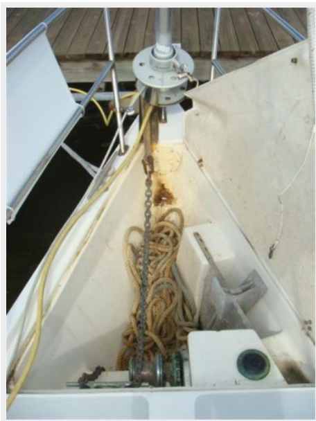
42' Catalina anchor windlass