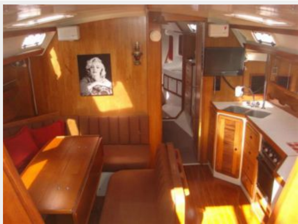
42' Catalina salon forward