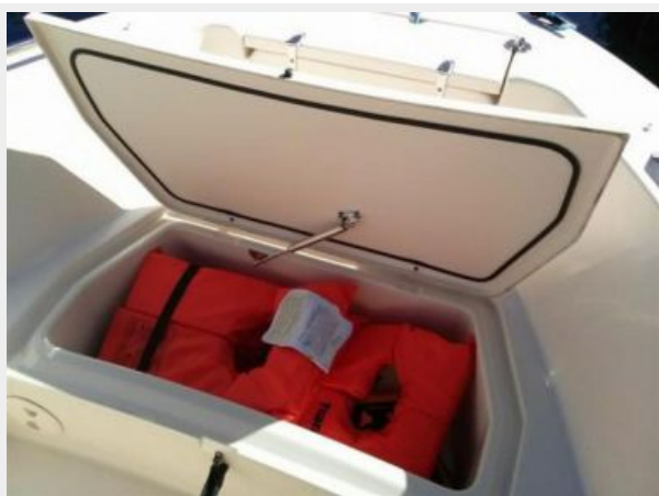
Bow Fish and/or Storage Box