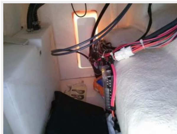
Under Console Wiring