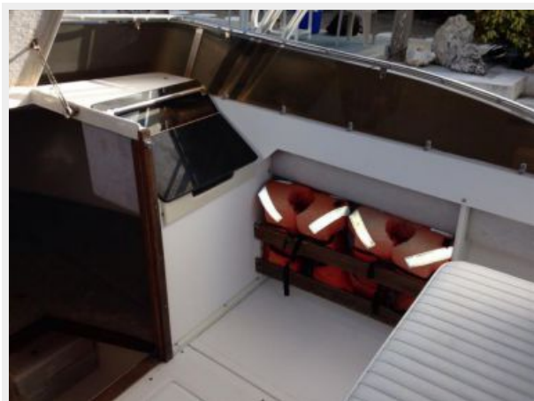
Forward of console starboard side