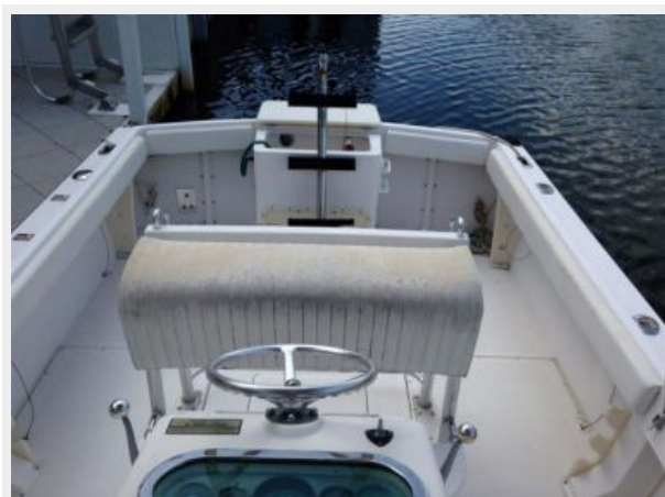
Console looking aft