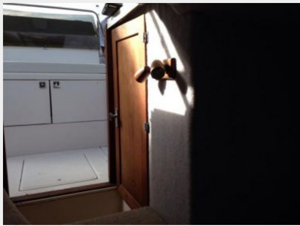
Looking aft in cabin