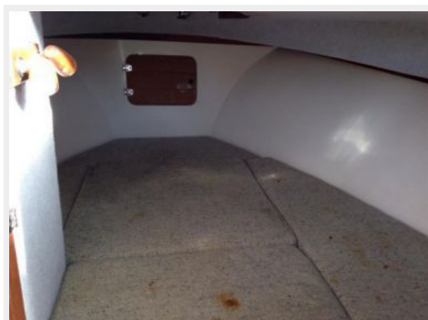
Cuddy cabin berth for two