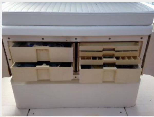
Forward front of console tackle storage