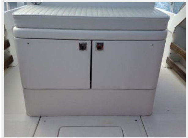
Forward front of console with tackle storage