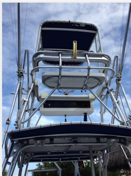
Half tower with Marline station and seating