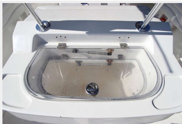
Large Live-Well In Leaning Post