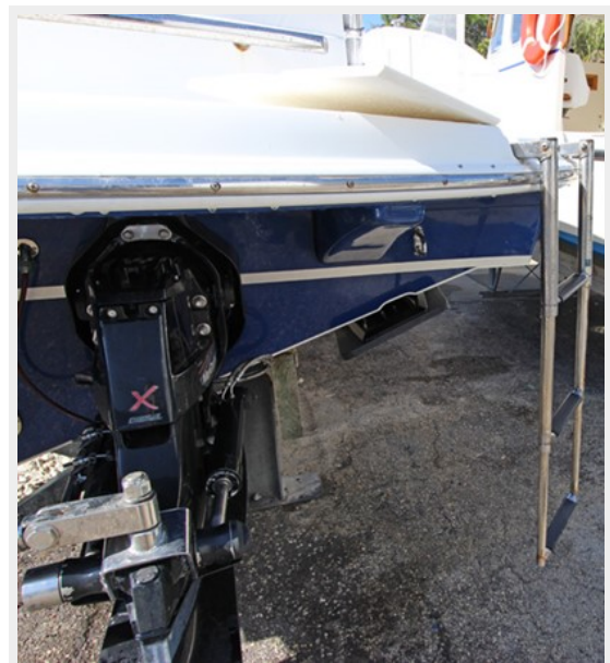
Stainless Fold-Down Ladders Port & Starboard On Transom