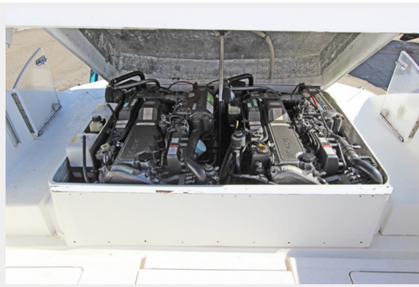
Transom Engine Compartment W/Twin 315 Yanmar Diesel Engines