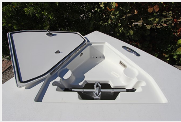
Forward Anchor Locker